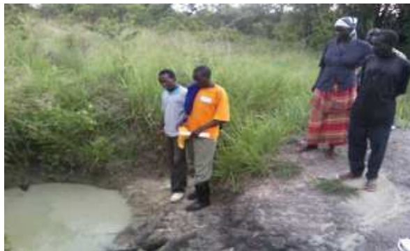
水源が家庭での使用に適しているかを調べているコミュニティ・リーダー