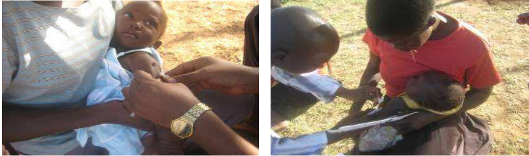
予防接種を受ける子どもたち（Alero 準郡のLangol 村）

的な予防接種の支援活動のほか、4月と10月の子ども保健デーには予防接種キャンペーンを実施し、予防接種を受けるようコミュニティを動員、また、保健チームに対して物流支援を行いました。その結果、1,263人の子どもの予防接種と1,937人の子どもの寄生虫駆除を実施、そして1,043人の子どもにビタミンAの栄養補助剤を配布しました。