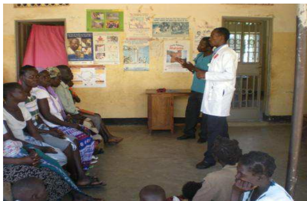
産前・産後の新生児ケアについて説明をするスタッフ（Alero 準郡の診療所）