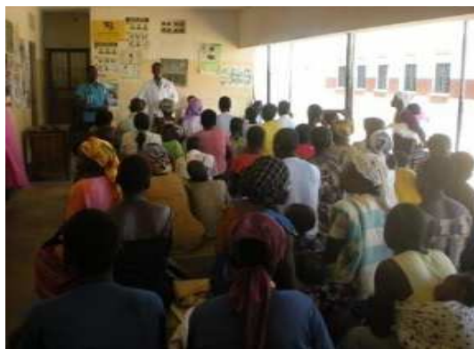
子どもの健康、栄養ある食事や衛生についての保健教育（Alero 準郡の診療所）